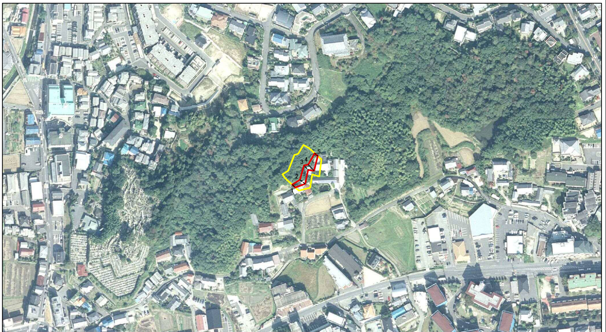
図中の数字は横断測線番号を示す